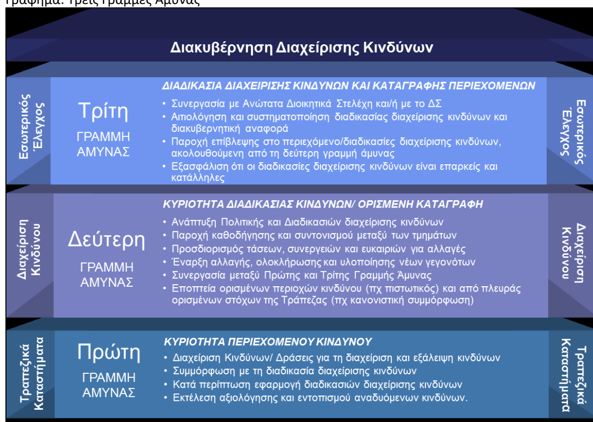
Γράφημα: Τρεις Γραμμές Άμυνας

Οι Μονάδες Εσωτερικού Ελέγχου και Διαχείρισης Κινδύνων δεν συμμετέχουν στη λήψη επιχειρησιακών αποφάσεων και τα μέλη που τις απαρτίζουν δεν έχουν κανενός είδους σχέση με τα υπόλοιπα διοικητικά στελέχη της Τράπεζας, εξασφαλίζοντας την εύρωστη, εύρυθμη και διαφανή περάτωση των καθηκόντων τους.